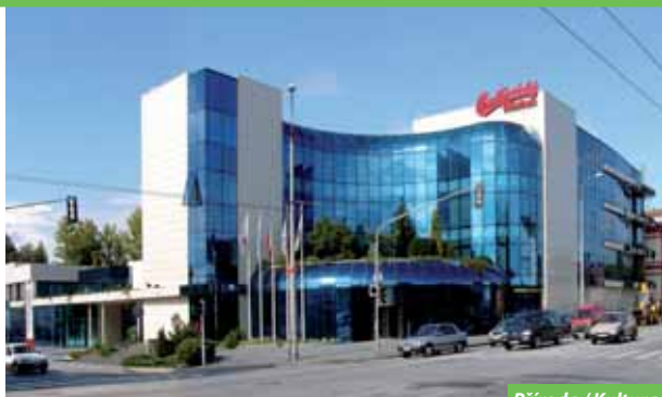
Příroda / Kultura