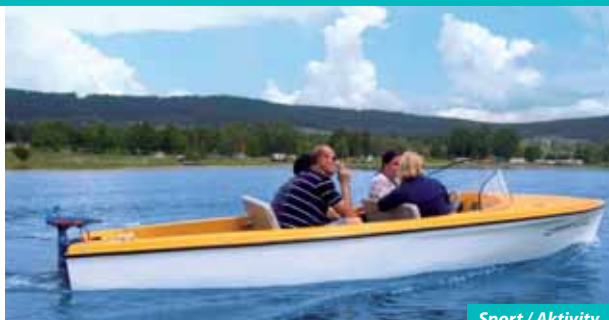
Sport / Aktivita