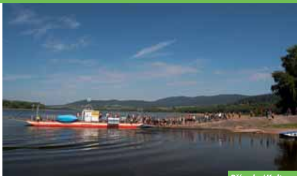
Příroda / Kultura

T: 387 705 341, 387 705 347 • E: exkurse@budvar.cz • W: www.budvar.cz