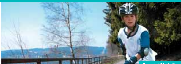
Sport / Aktivita

T: 773 444 595 • E: pujcovna@lipnocentrum.cz • W: www.lipnocentrum.cz